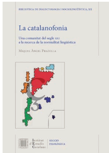
FOTOGRAFIA 13. Coberta del llibre.