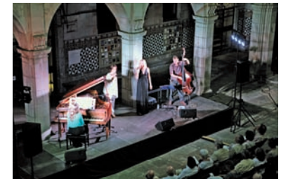
FOTOGRAFIA 32. El trio vocal Entreveus, acompanyat de piano i contrabaix, al pati de l'IEC.