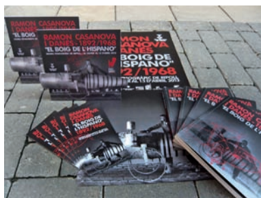
FOTOGRAFIA 25. Cartells i fulls informatius de l'exposició.