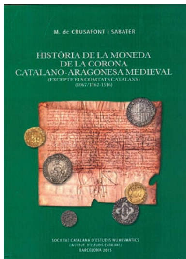
FOTOGRAFIA 14. Coberta del llibre.