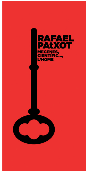
FOTOGRAFIA 26. Invitació per a l'exposició sobre Rafael Patxot.