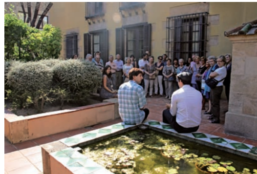
FOTOGRAFIA 29. Escena de la representació teatral dedicada a Ramon Margalef, al jardí Mercè Rodoreda.

Organitzat per la Unitat de Cultura Científica i Innovació (UCC+i) de l'Àrea de Comunicació i el Grup de Recerca Aula Música Poètica de la Facultat de Filologia de la UB.