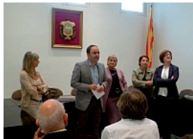
FOTOGRAFIA 3. Presentació de les Jornades de la Secció Filològica al Casal Municipal de Móra la Nova.