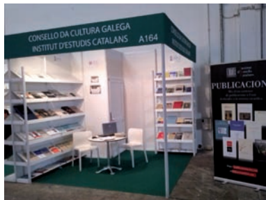
FOTOGRAFIA 2. Estand de l'IEC i el Consello da Cultura Galega a la Fira Internacional del Llibre, LIBER 2014, situada al recinte de Montjuïc de la Fira de Barcelona.